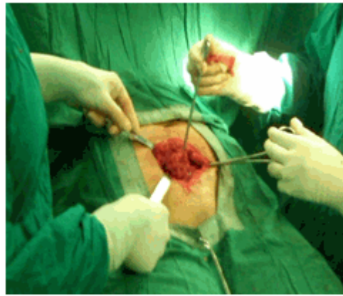
Figura 2. Momento de la operación donde se está realizando la excéresis del endometrioma.

mm X 40 mm de color rosa pálido, que toma la aponeurosis, de consistencia sólida. (Figuras 2 y 3).