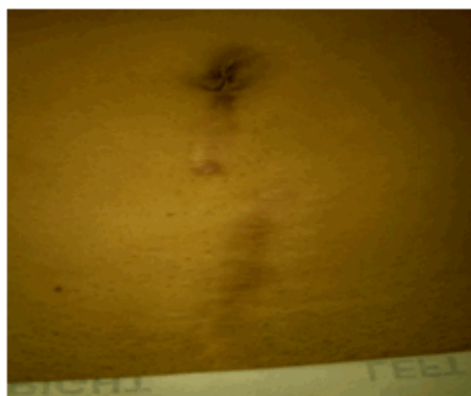
Figura 1. Imagen que muestra cicatriz media infraumbilical de la cesárea anterior.

Abdomen: presencia de cicatriz media infraumbilical que en su medio presenta un tumor de aproximadamente 4 cm, doloroso a la palpación superficial y profunda e irreductible. (Figura 1).