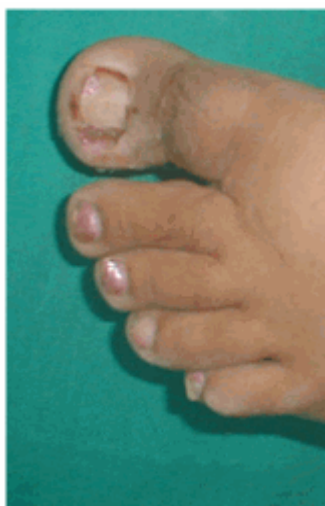
Figura 20. Segunda cura.

La segunda cura se realizó a las 96 horas. Se descubrió la lesión, se examinó el estado de evolución y se procedió a realizar una cura seca con alcohol 75 % (Figura 20). Se le indicó continuar con las curas durante 10 días.