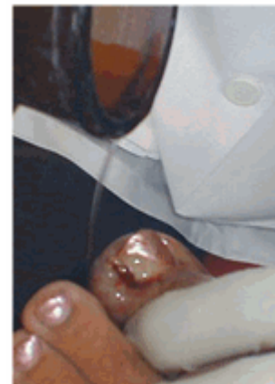
Figura 13. Lavado con alcohol 90°

Posteriormente se realizó la aplicación del fenol al 80 %, en el borde y surco ungueal llegando hasta la matriz durante 45 segundos. (Figura 12) Después se lavó con alcohol 90° para neutralizar el efecto residual del fenol. (Figura 13) Una vez realizado esto se legró nuevamente para escorear el lecho y matriz ungueal con el propósito de destruir células germinativas. Esta técnica de fenolización se repitió una vez más. 3,4