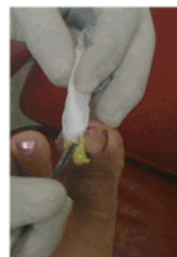
Figura 18. Colocación de nueva mecha.

A las 48 horas de la intervención se realizó la primera cura. Después de descubierta la lesión (Figura 16) se retiró la mecha, se lavó la zona con alcohol 75 % u otro tipo de antiséptico (Figura 17), posteriormente se colocó una nueva mecha en el surco ungueal con crema antibiótica (Figura 18) y se procedió a vendar la lesión. (Figura 19).