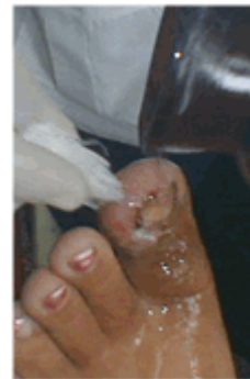
Figura 17. Lavado de la lesión

Se le indicó tratamiento con azitromicina 125 mg (1 cap. cada 12 horas) por 7 días.