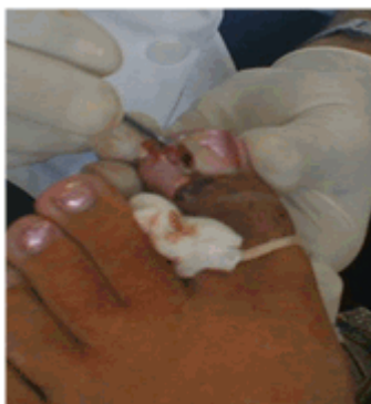
Figura 11. Reconstrucción del canal ungueal

Tras el legrado se confrontó el borde contra la uña y se comprobó la nueva posición del borde ungueal y de la uña. Se planificó la retirada del mamelón, que en este caso incluyó la extracción del granuloma. (Figura 11).