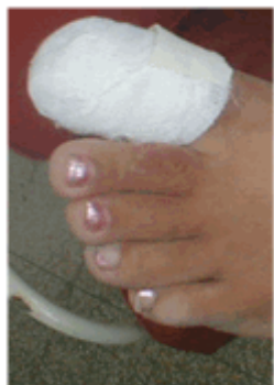
Figura 19. Vendado.