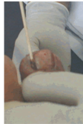
Figura 12. Aplicación del fenol al 80 %

Tras el legrado se confrontó el borde contra la uña y se comprobó la nueva posición del borde ungueal y de la uña. Se planificó la retirada del mamelón, que en este caso incluyó la extracción del granuloma. (Figura 11).