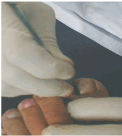
Figura 10. Legrado del surco ungueal.