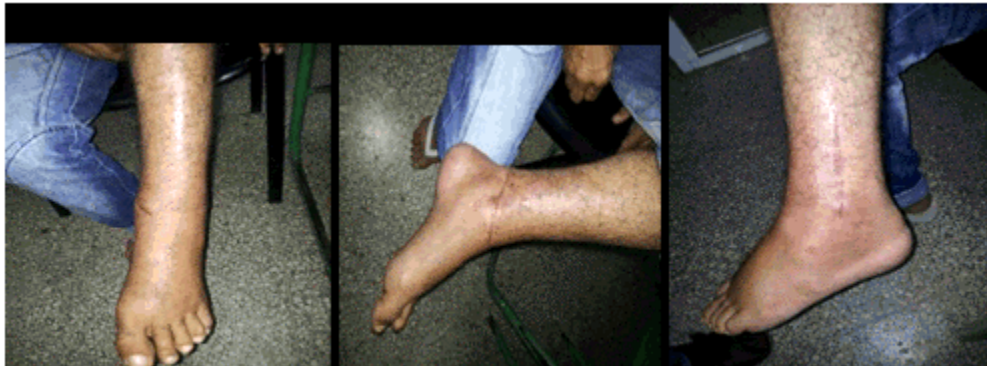
Figuras 5, 6 y 7. Imágenes donde se muestra el tobillo a los tres meses de la cirugía.

A los tres meses de la cirugía, el tobillo estaba prácticamente recuperado.(Figuras 5, 6 y 7).