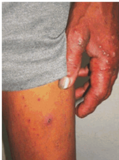
Figura 3. Lesiones eritematosas y vesiculosas en mano izquierda, y eritemato-costrosas en muslo de ese lado. Presencia de algunas pústulas en dorso de mano.

Específicamente en la cavidad oral, se encontraron lesiones candidiásicas, pseudomembranosas y blanquecinas en lengua, carrillos y comisuras labiales, además de varias caries dentales (Figura 4).