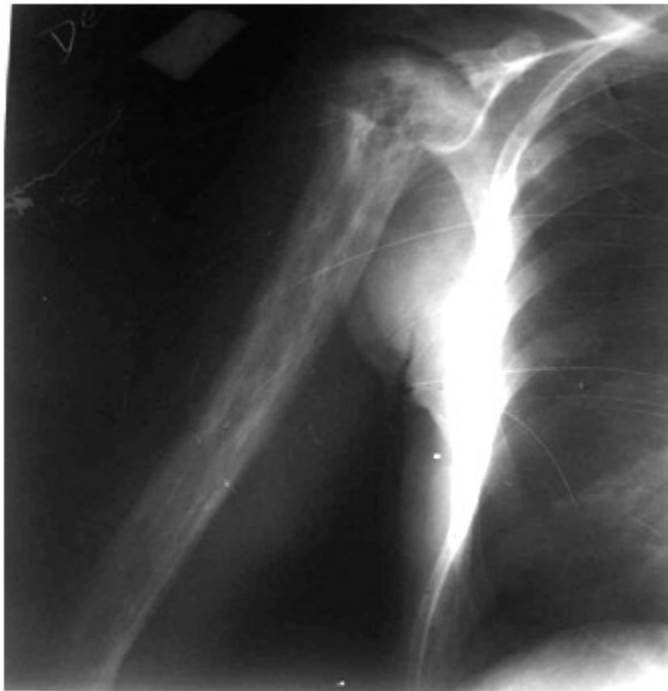
Figura 1. Radiografía simple de húmero derecho, anteroposterior, donde se observa alteración de la estructura ósea que compromete todo el hueso, caracterizada por expansión ósea, engrosamiento cortical y trabecular. Destaca a nivel de epífisis humeral una extensa área radiolúcida, marginada por esclerosis.

La radiografía comparativa del miembro contralateral fue negativa. (Figura 2).