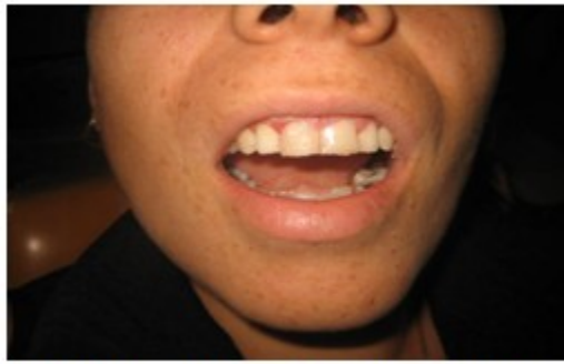
Figura 5. En esta imagen se muestra el exceso de material.

7. Se eliminó el exceso de material en torno al margen antes de polimerizar la resina.