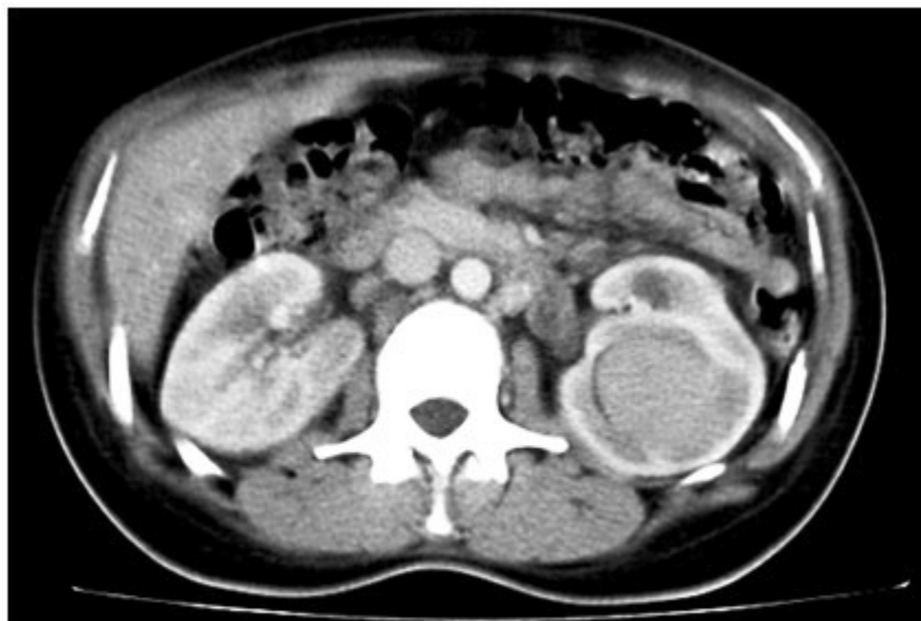
Figura 3. Imagen tomográfica renal simple que muestra imagen hiperdensa de 90 UH. Redondeada, de contornos definidos que mide 4 cm ubicado en la porción media del riñón que provoca compresión el grupo calicial.

La paciente se remitió al Servicio de Urología del Hospital Gustavo Aldereguía Lima con el diagnóstico de quiste renal hiperdenso del riñón izquierdo, categoría II. Se sugirió evolución bajo control ultrasonográfico.