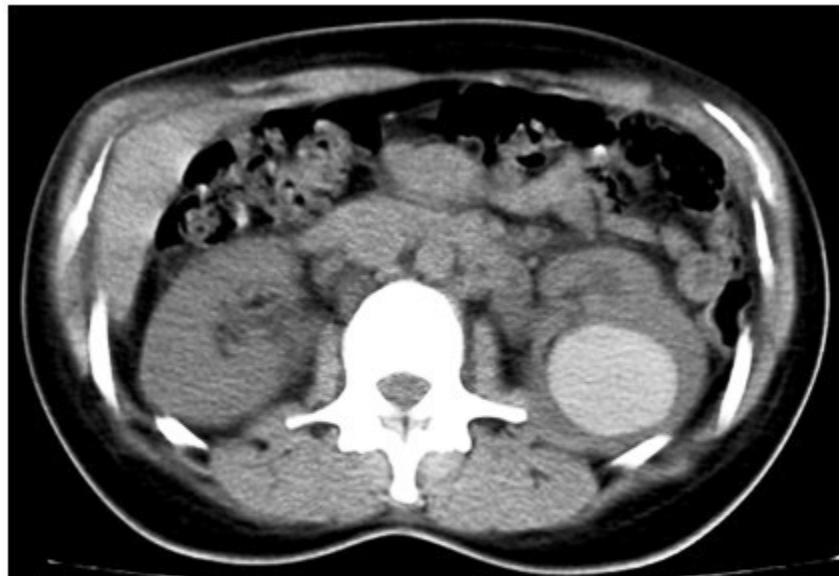
Figura 2. Imagen tomográfica renal simple que muestra imagen hiperdensa de 90 UH. Redondeada, de contornos definidos que mide 4 cm ubicado en la porción media del riñón que provoca compresión el grupo calicial.