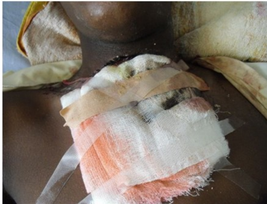
Figura 1. Imagen que muestra trayecto fistuloso a nivel del cuello que se extiende al tórax.

Se le realizó estudio de la lesión mediante el que se constató un proceso inflamatorio subcutáneo con un denso infiltrado inflamatorio que estaba constituido por linfocitos, histiocitos y neutrófilos. Se inició tratamiento con cefalexina (500 mg cada seis horas durante 15 días), pero el paciente no mejoró. Al transcurrir 24 días comenzó a padecer de fiebre elevada, tos húmeda con expectoración verdosa, sensación de opresión torácica y disnea intermitente. Al examen físico se constató: