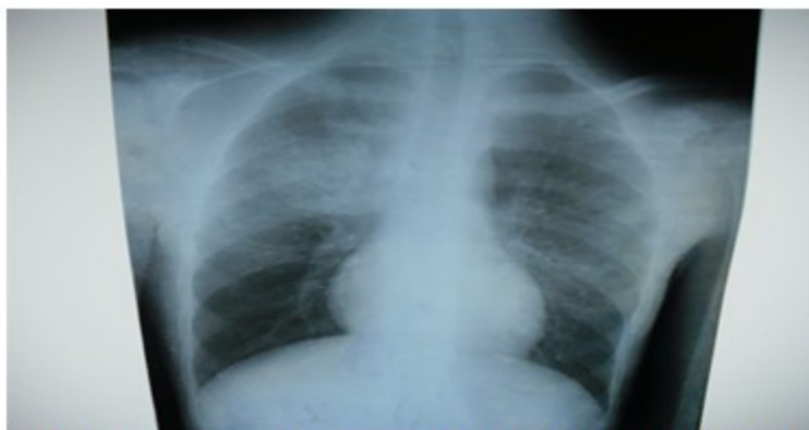
Figura 2. Imagen radiográfica que muestra opacidad homogénea, con bordes bien definidos en el hemitórax derecho.

En la tomografía axial computarizada de tórax se confirmó la presencia de una imagen en el