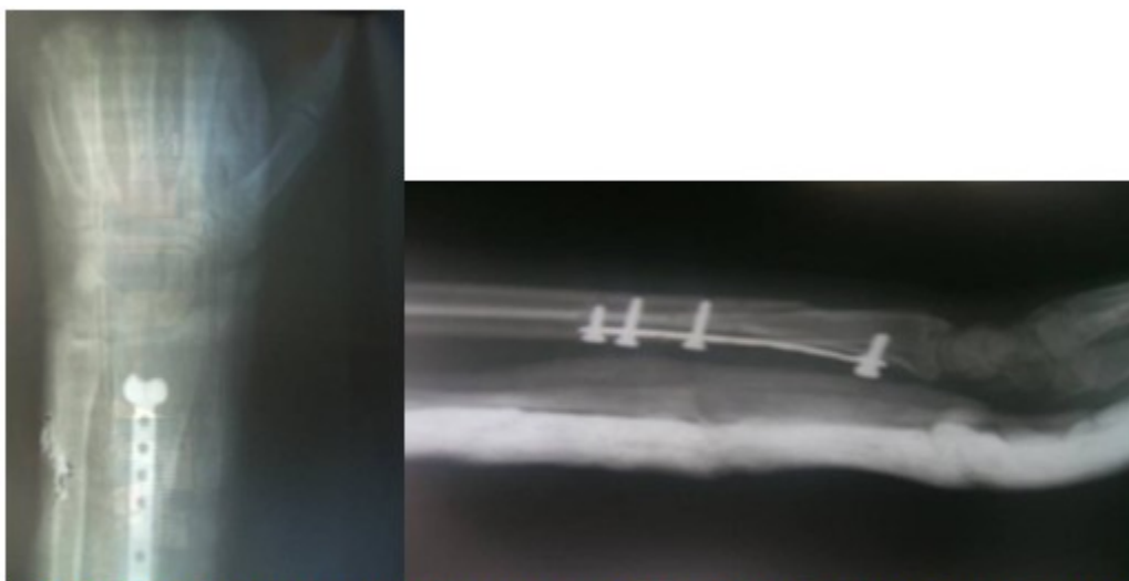
Figuras 5 y 6. Radiografías anteroposterior y lateral a las cuatro semanas de operada que muestran la férula ante braquial.

A las seis semanas después de retirada la férula antebraquial se indicó fisioterapia a la paciente para rehabilitación. A las diez semanas la