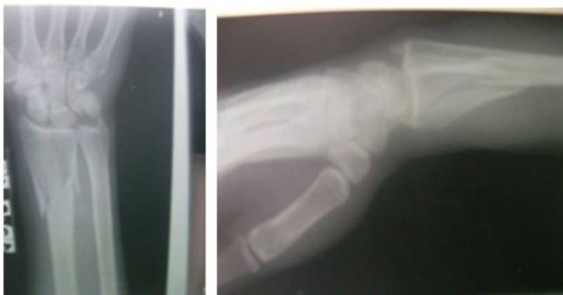
Figuras 1 y 2. Imágenes radiológicas anteroposterior y lateral de muñeca donde se observa la fractura cominuta, articular del extremo distal del radio.

La paciente a su llegada al Hospital fue examinada minuciosamente y sometida a exámenes radiológicos y de laboratorio. (Figuras 1 y 2).