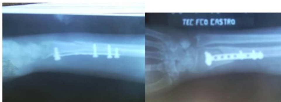
Figuras 7 y 8. Radiografías a las seis semanas de operada.

paciente se incorporó a su vida habitual y a su trabajo de oficina. Se le dio de alta con una función completa de la articulación de la muñeca. (Figuras 7,8, 9,10,11 ).