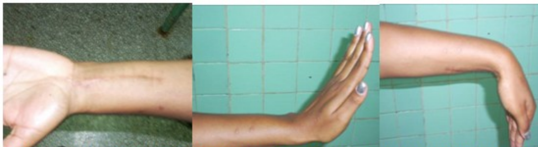
Figuras 9, 10 y 11. Imágenes donde se pueden observar la cicatriz de la operación y los puntos donde estuvo el minifijador, además de la función de flexión dorsal y palmar de la mano, a las diez semanas de operada.