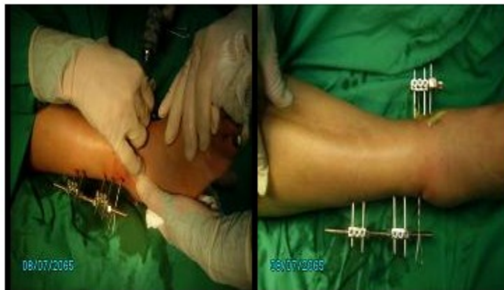
Figuras 3 y 4. Imágenes finales del procedimiento quirúrgico.

Una vez realizados estos procedimientos queda colocado el minifijador. (Figuras 3, 4)