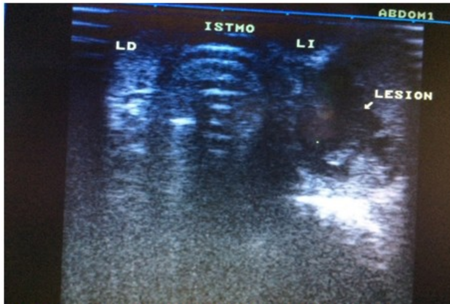
Figura 1. Ultrasonido donde se muestra la tumoración paratifoidea.

La biopsia por aspiración con aguja fina (BAAF), informó citología negativa de células neoplásicas y probable adenoma.