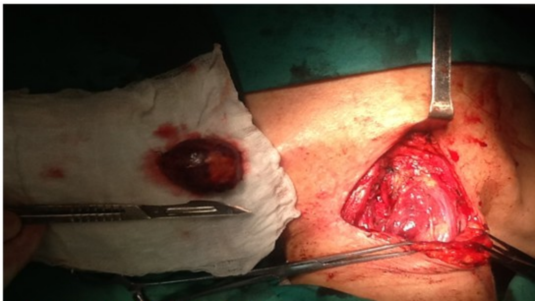
Figura 3. Adenoma paratiroideo ya extraído.

Fue egresada con evolución satisfactoria y seguimiento por consulta externa. Los valores de PTH posquirúrgicos fueron normales desde el primer control. El estudio anatomopatológico del caso, informó de la presencia de un adenoma paratiroideo en la parte inferior izquierda de la glándula paratiroides.