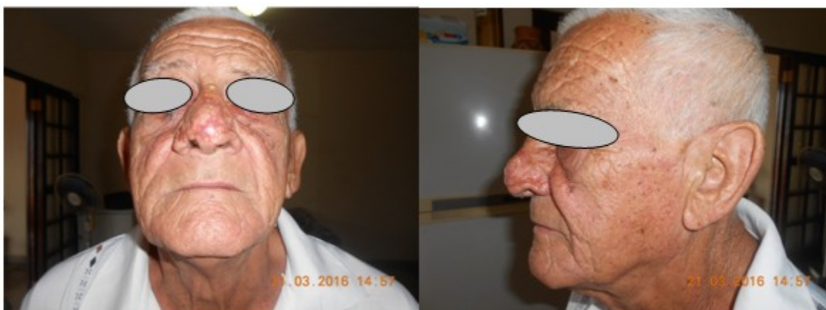
Figura 3. Vistas frontal y lateral que muestran el resultado de la reducción del rinofima (Caso 1).

El resultado de la cirugía fue satisfactorio en ambos casos (Figura 3, figura 4).