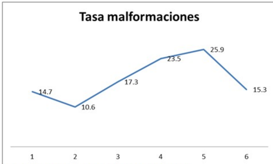
Gráfico 1. Prevalencia de malformados según años de estudio. Cienfuegos 2008-2013.

Fuente: Departamento de Estadísticas Salud Provincial.