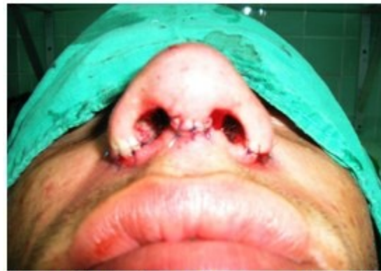
Figura 4. Se observa la sutura en base de la columela y alas nasales para estrechamiento de las narinas.

Las imágenes y datos han sido utilizados previo consentimiento informado a los pacientes. Para la realización del estudio se contó con la aprobación del Consejo Científico de la Institución.