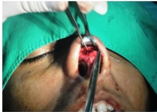
Figura 3. Se observan los cartílagos del domo expuestos.