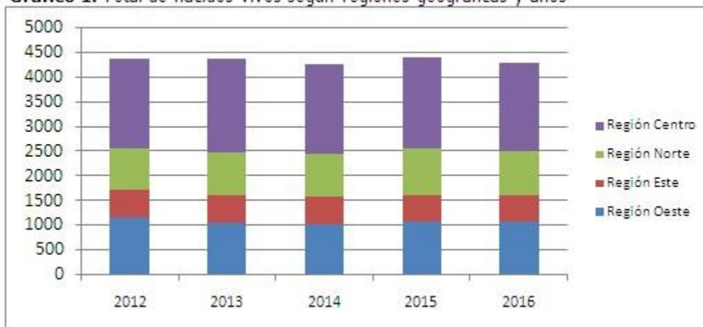
Gráfico 1. Total de nacidos vivos según regiones geográficas y años

Se observó una distribución heterogénea del porcentaje de positividad de la primera determinación (UMELISA TSH NEONATAL) según regiones geográficas y años. Las regiones oeste (1,87%), norte (1,34%) y este (1,33%) muestran los mayores valores de positividad que contrastan con los expuestos en la región centro