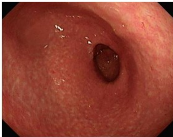
Figura 3: Imagen de antro gástrico de la paciente posterior a 4 secciones de tratamiento endoscópico de coagulación con argón plasma. Se observa una mucosa con múltiples lesiones blanquecinas de aspecto cicatrizal en antro gástrico, sin evidencias de las lesiones vasculares reportadas.