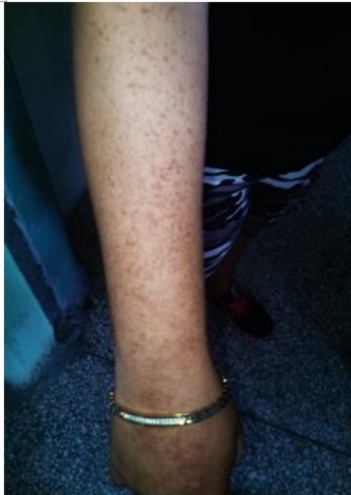
Figura 2. Máculas hiperpigmentadas puntiformes en miembro superior derecho al acudir a consulta.