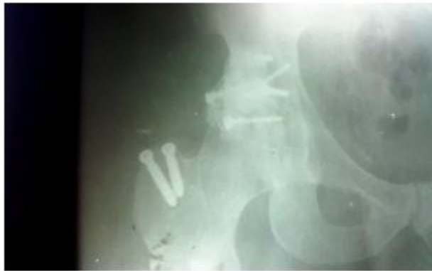
Figura 4. Imagen radiográfica de la cadera afectada, después de realizada la cirugía. Se muestran los tornillos y el alambre de cerclaje empleados en la reconstrucción acetabular así como los tornillos empleados para la fijación del trocánter mayor.

Durante la exploración quirúrgica se constató la presencia de gran lesión del muro y pared posterior, con zonas de gran conminución; en el fondo acetabular existían fragmentos que fueron retirados, la exploración de la cabeza femoral nos mostró daños a nivel del cartílago articular y la desinserción del ligamento redondo.