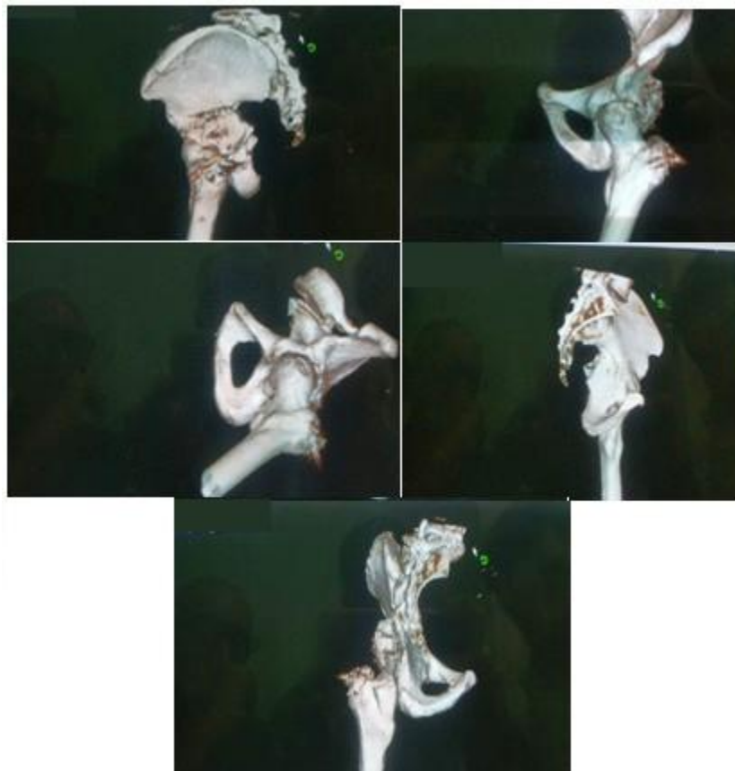
Figuras 5 a 9. Reconstrucciones en 3D realizadas tras la cirugía con el objetivo de mostrar la reducción obtenida con el tratamiento quirúrgico realizado.

El paciente se mantuvo por un periodo de tres meses en descarga tras los cuales comenzó con apoyo parcial con seguimiento radiológico mensual por un periodo de ocho semanas.