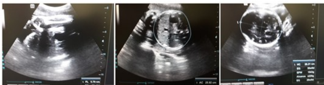
Figura 3. Imágenes de la ecografía realizada al término del primer trimestre de la gestación.

momento a los servicios obstétricos, constituyó un resultado importante. Se consideró como de alto riesgo obstétrico, y se realizaron orientaciones específicas para el seguimiento en la atención prenatal, al existir altas probabilidades de morbimortalidad perinatal. La evolución clínica ha sido favorable hasta el tercer trimestre, sin patologías propias o asociadas al embarazo, y con curvas de peso, tensión arterial y de altura uterina acordes al período de gravidez. Se realizó ecografía obstétrica correspondiente al período gestacional, que confirmó el completo bienestar materno fetal. (Figura 3).