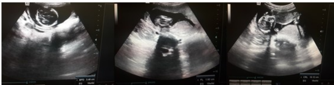
Figura 1. Secuencia de imágenes de la ecografía obstétrica diagnóstica. Diámetro biparietal (BPD, del inglés biparietal diameter ) de 34 mm- 16.0 semanas, longitud del fémur (FL, del inglés femur length ) 19 mm-15.5 semanas y longitud céfalo-caudal (CRL, del inglés crown-rump length ) 101 mm-16 semanas.

En embarazo previo, con edad gestacional de 40 semanas, ingresó en el servicio de partos y parto con diagnóstico de rotura prematura de membranas (RPM), con líquido amniótico meconial para interrupción del embarazo mediante la inducción con oxitocina.