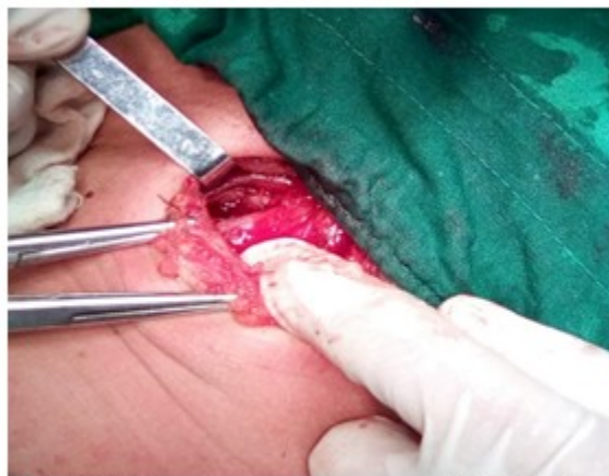
Fig.7- Biopsia de segmento del lóbulo izquierdo.

En el lóbulo izquierdo se realizó el mismo procedimiento. Pudo comprobarse que este presentaba una capsula gruesa, de unos 0,4 mm y el interior de la glándula comenzaba a tomar el aspecto de un tejido macerado, del cual se realizó biopsia mediante incisión en cuña de la glándula y, hemostasia en sitio cruento. (Fig. 7).