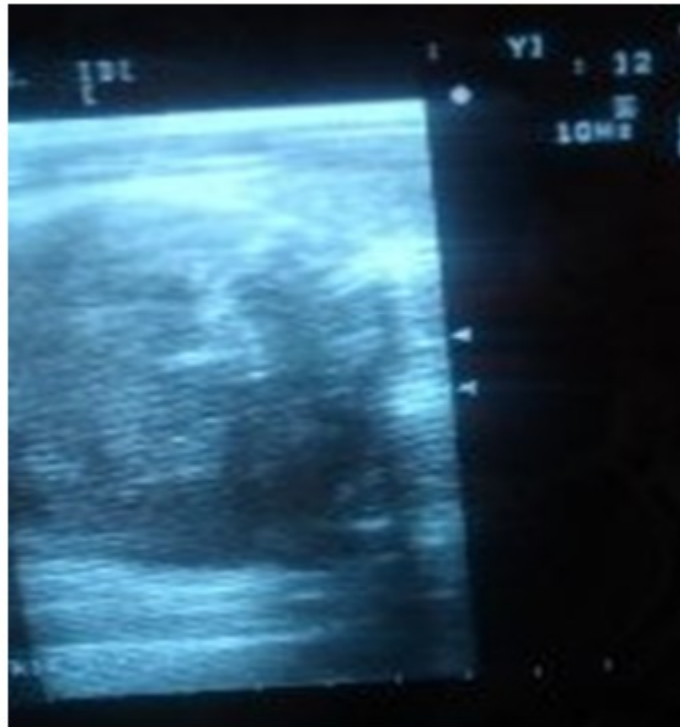
Fig. 4- Ultrasonido de cuello: Lóbulo derecho aumentado de volumen con el aspecto de un hematoma intraglandular.

Tres días después, los signos de compresión a nivel del cuello se fueron agudizando, y fue necesario realizar un ultrasonido evolutivo, pues el riesgo de asfixia estaba latente, debido a la coagulopatía, y la posibilidad de que el cuadro de “sangramiento” continuara en aumento, y provocara mayor compresión en tráquea y