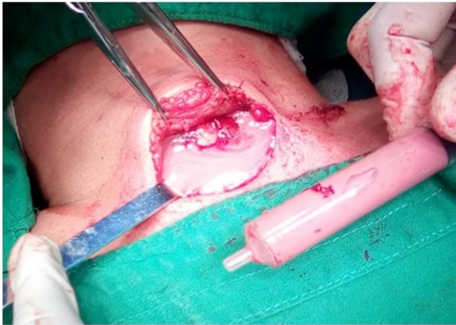
Fig. 6- Absceso de la glándula tiroides.

Se realizó aspiración del pus con la aspiradora de pared y lavado de la cavidad con iodopovidona y suero fisiológico. Se observó que la cavidad del absceso estaba dirigiendo sus trayectos hacia la región submaxilar derecha, cartílago cricoides y por la parte inferior del istmo, comenzando a comunicar con el lóbulo contralateral, parte de la glándula, y se prolongaba hacia el mediastino,