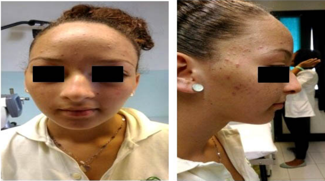
Fig. 6 y 7. Imágenes donde se observa dismorfismo craneofacial leve, hipertelorismo, hipoplasia maxilar con aplanamiento del tercio medio facial, frente prominente, y puente nasal ancho y aplastado