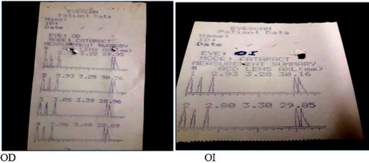
OD Fig. 5. Estudio biométrico.

Alteraciones no oculares: dismorfismo craneofacial leve, hipertelorismo, hipoplasia maxilar con aplanamiento del tercio medio facial,