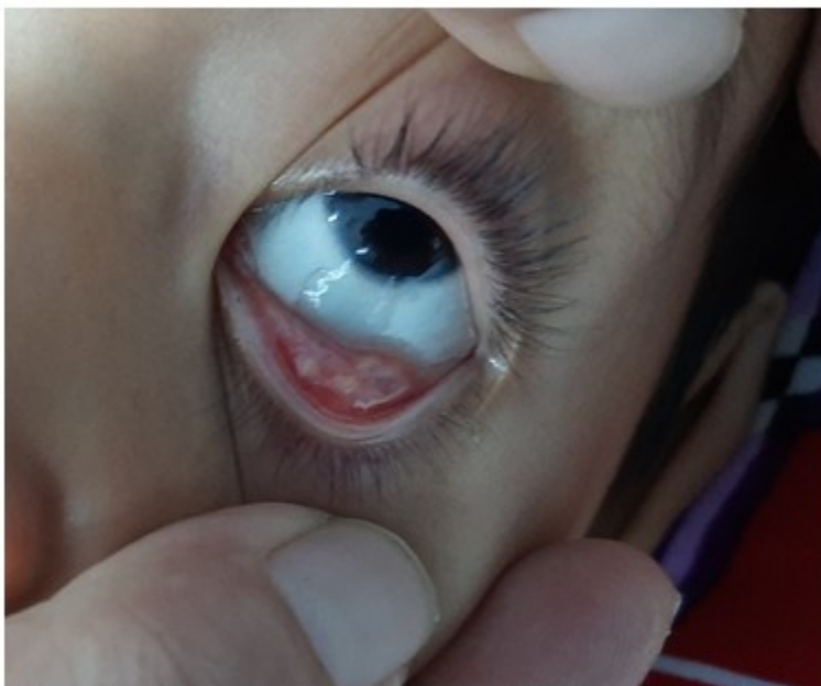
Fig. 1- Granuloma en conjuntiva tarsal del ojo izquierdo.

Al quinto día de su estancia, se apreció mejoría ligera desde el punto de vista clínico, pero se detectó tumoración blanquecina en conjuntiva tarsal de ojo izquierdo (diámetro 1x1cm), identificada por el oftalmólogo como granuloma. (Fig. 1).