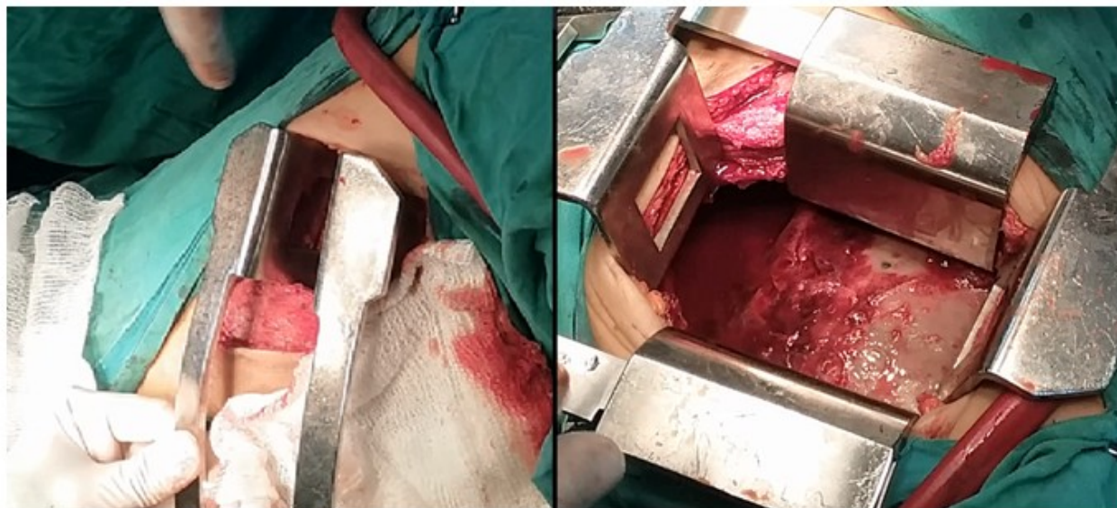
Fig. 2- Secuencia de la colocación de los separadores, período en que la relajación muscular debe ser óptima

La fluidoterapia intravenosa transoperatoria debe ser restringida en pacientes sometidos a resecciones pulmonares, pues la hidratación excesiva se asocia a injuria pulmonar aguda en el período postoperatorio y trasudado de líquido en el pulmón dependiente en la posición de decúbito lateral, lo que incrementa el shunt intrapulmonar. (15)