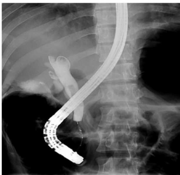
Fig. 5: La colangiopancreatografía endoscópica retrógrada muestra un gran defecto de llenados lineales y múltiples pequeños defectos de llenado.

cálculos de las vías biliares mediante barrido con balón, el conducto hepático derecho lucía con reducción de su diámetro por estenosis fibrótica que, aunque permitió el paso de la sonda, no fue posible la colocación de stent. No obstante, se logró colocar stent en el colédoco. Se complementó tratamiento con antibioticoterapia, piperacilina y tazobactam por vía intravenosa. Posterior a la colangiopancreatografía endoscópica retrógrada, se planteó el diagnóstico de colangitis piógena recurrente.