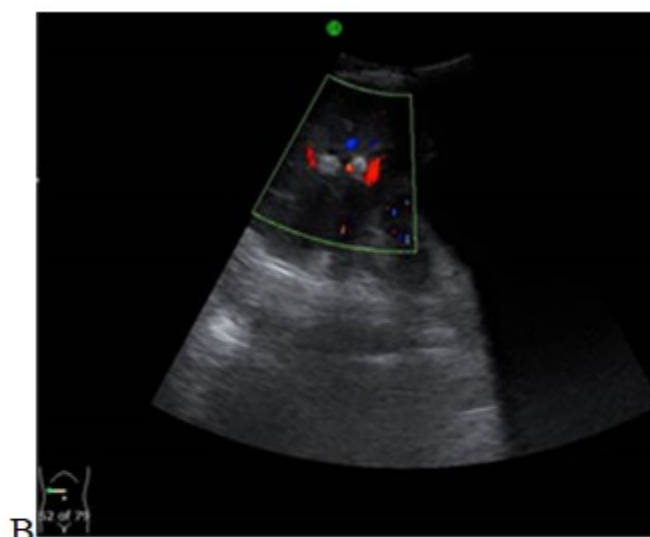
Fig. 2: La vista axial a nivel de las vías biliares intrahepáticas muestra hiperecogenicidad (litisias) dentro de los conductos biliares intrahepáticos dilatados. (B).