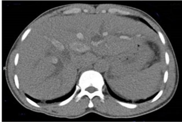
Fig. 3: Tomografía axial computarizada de abdomen, vista axial a nivel hepático sin contraste

los cuales lucían dilatados. En la figura 4 se comprobó: páncreas de tamaño normal, con mínima cantidad de líquido y edema peri pancreático, confirmando el diagnóstico de colecistitis litiásica y pancreatitis aguda secundaria, dilatación y litiasis de vías biliares intra y extrahepáticas.