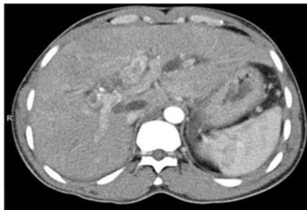
Fig. 4: Tomografía axial y con contraste en la fase arterial, muestra hiperdensidad (densidad de calcio) en la vía biliar dilatada por presencia de litiasis en las vías biliares.