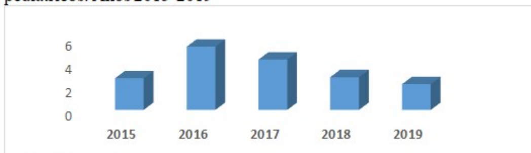
Gráfico 1. Incidencia de casos con IAAS. Unidad de Cuidados Intensivos pediátricos. Años 2015-2019

Tasa x c/ 100 egresados Fuente: Dpto. Estadística CPHEM.