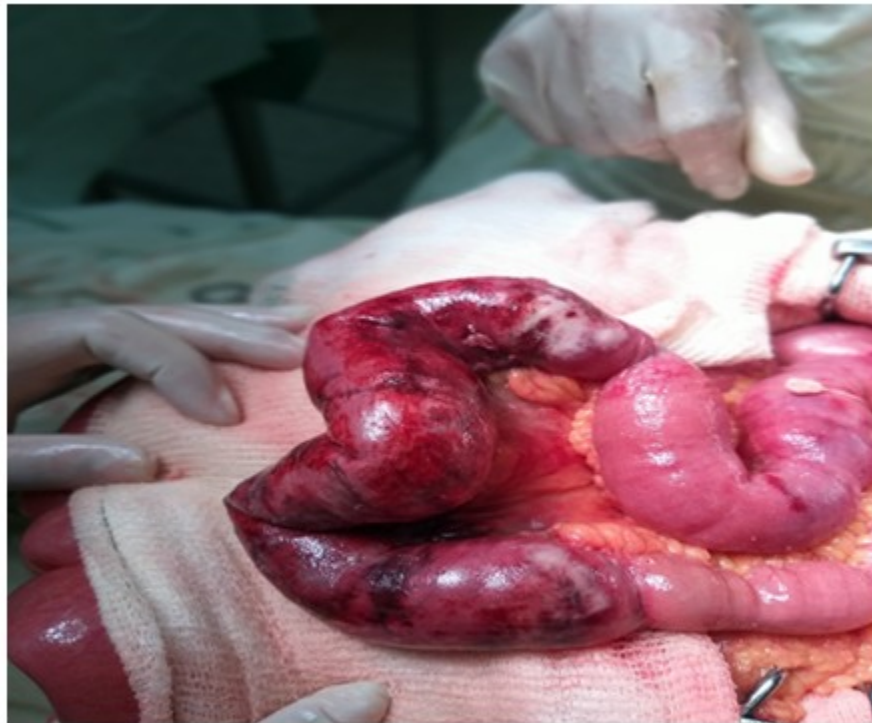
Fig. 2. Imagen donde se observa el asa ileal con compromiso vascular.

Se realizó cierre del cabo distal y anastomosis ileotransverso termino lateral en dos planos.