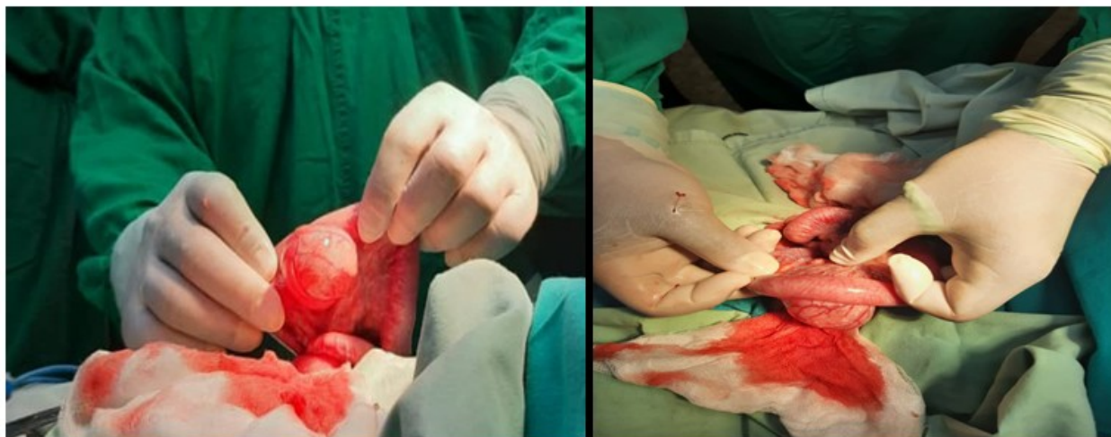
Fig. 3 Piezas quirúrgicas de la duplicidad intestinal quística no comunicante.

encontraba en el borde mesentérico, mediante resección y anastomosis termino-terminal. El estudio histológico informó la presencia de duplicidad intestinal ileal con presencia de tejido pancreático y gástrico heterotópico. (Fig.3).