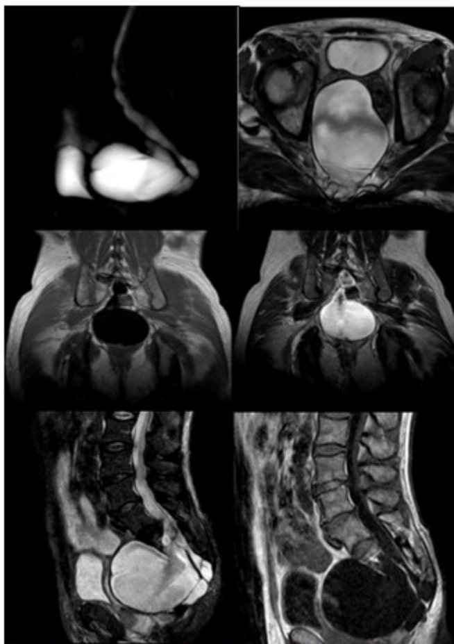
Fig. 2- Resonancia magnética (RM) lumbosacra (secuencia sagital, coronal, mielo resonancia y axial). T1: proceso expansivo hipointenso en pelvis. T2: hiperintenso, que dependía de saco dural a través de un defecto; meningocele sacro anterior asociado a médula anclada.

Por todos los hallazgos imagenológicos detectados, se planteó el diagnóstico de tumor renal, síndrome de Currarino incompleto (dado por dos elementos de la tríada: malformación sacro coccígea y masa presacra), asociado a otra enfermedad malformativa raquímedular, médula anclada.