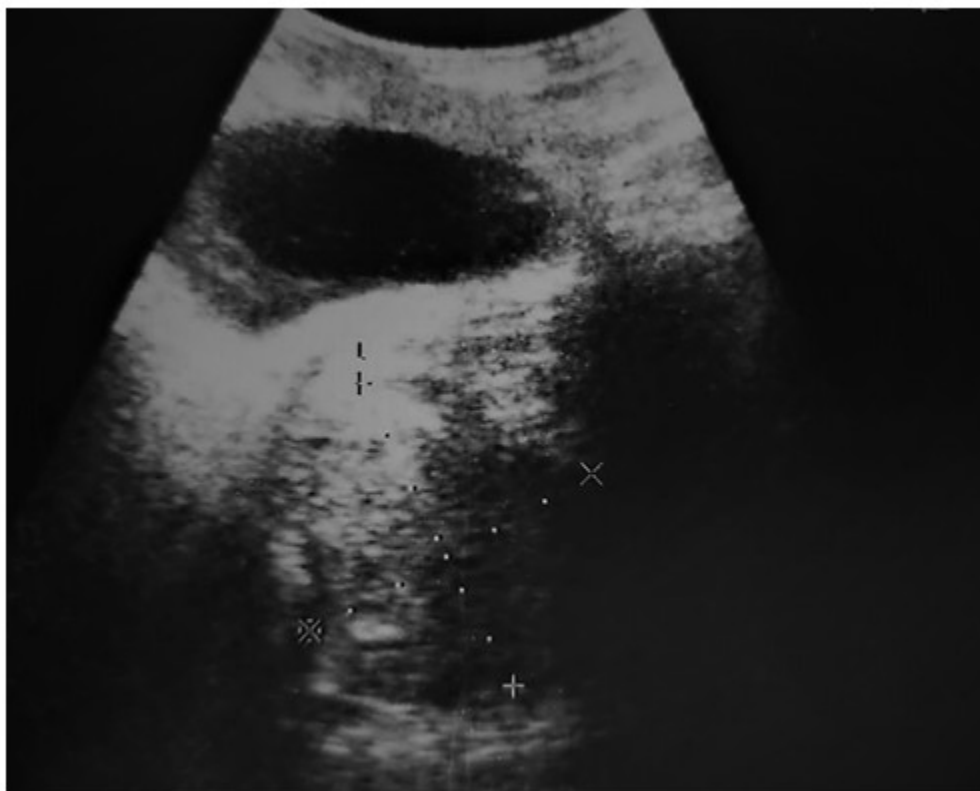
Fig. 1- Vista de imagen de ultrasonido, la cual mostró imagen tumoral retrovesical de 60x68mm por detrás de la próstata.

TAC abdominal: evidenció, por detrás de la pared vesical y anterior al recto, una imagen ocupativa de espacio, hipodensa irregular que realzaba discretamente el contraste, con calcificaciones groseras de 72x52 mm.