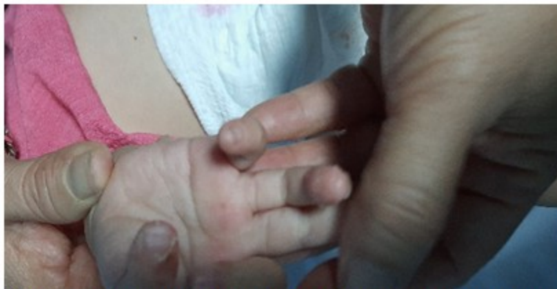
Fig. 3. Erupción descamante ubicadas en manos y pies del paciente.

Otros aspectos del examen físico, arrojaron: