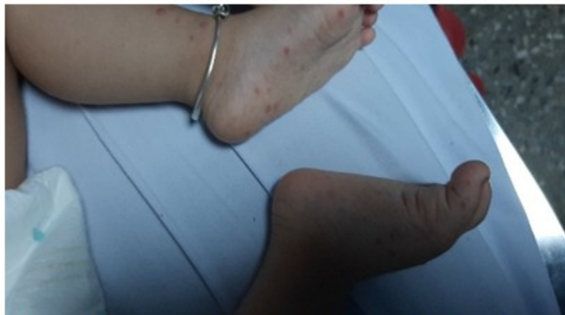
Fig. 2. Lesiones maculo-papulosas ubicadas en los pies del paciente.