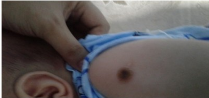
Fig. 1. Lesión melicérica en área correspondiente a huella vacunal de la BCG.

además, lesión numular melicérica con bordes amarillentos bien definidos a nivel de la huella vacunal de la BCG, área puntiforme con salida escasa de líquido amarillento. (Fig. 1, Fig. 2 y Fig. 3).