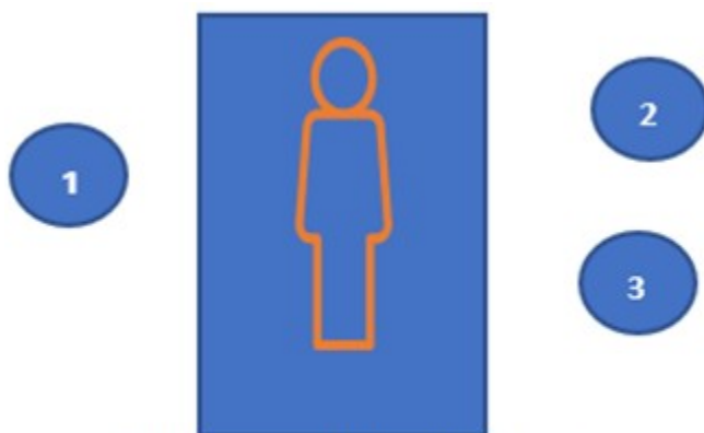
Fig. 2. Esquema de la simulación.

Ingresaban al escenario tres estudiantes, quienes bajo la consigna de ser fisioterapeutas respiratorios debían abordar al paciente evaluarlo y analizar para llegar al diagnóstico fisioterapéutico presuntivo, a los objetivos fisioterapéuticos y al desarrollo de un plan de tratamiento en fisioterapia respiratoria. Posteriormente se hizo la retroalimentación con el docente sobre la experiencia vivida, cómo se sintieron, cuáles fueron las fortalezas y debilidades, cómo se puede mejorar la intervención, el acercamiento de la teoría a la práctica y la aplicación de la escena en el campo clínico real. (Fig. 2).