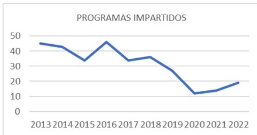
Fig.1. Programas impartidos según año fiscal

que ascendió a 310, y con ello se elaboró un gráfico de tendencia. Durante los años 2013 al 2018 hubo estabilidad en el número de programas de superación profesional desarrollados, con ligeras fluctuaciones; y una regresión en la cantidad, con el pico más bajo en el año 2020, a partir del cual la tendencia es ascendente. La forma organizativa más utilizada es el curso con 179 programas, seguido de taller 102, y el resto se divide entre diplomado, evento y entrenamiento, en ese orden. (Fig.1).