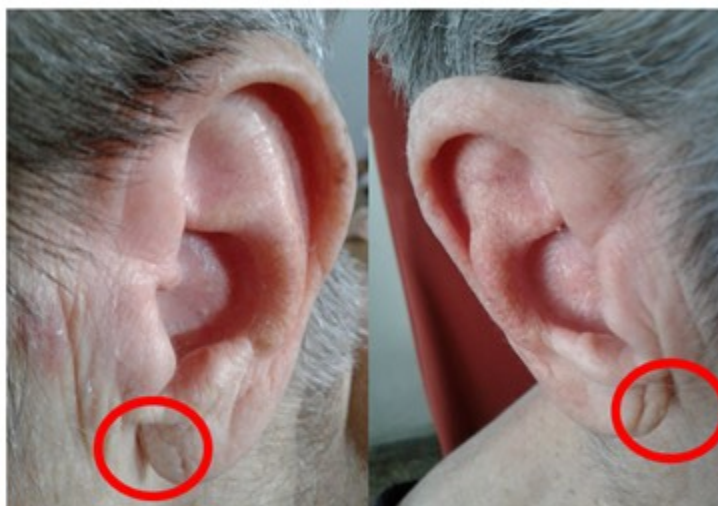
Fig. 1- Vista del pliegue del lóbulo de la oreja correspondiente a la hipertensión arterial (bilateral, profundo en el lóbulo derecho; superficial en el lóbulo izquierdo) en una paciente del estudio.

Se evaluó a los pacientes a los siete días, a los 15 días, al mes, los tres meses, seis meses, nueve meses y al año, para precisar si en ese periodo de tiempo desarrolló la enfermedad de HTA o presentó cifras elevadas de TA.