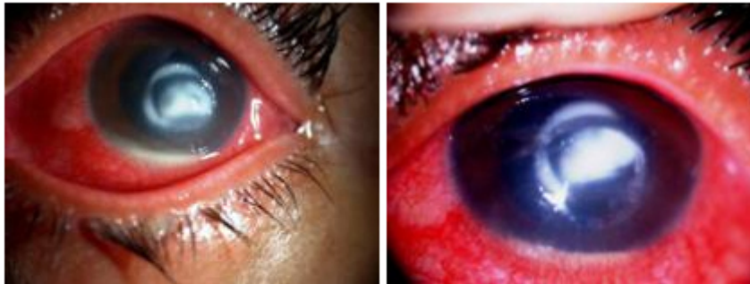
A: al diagnóstico. B: 9 días después de haber comenzado el tratamiento.

Por su parte, el grupo que recibió solo tratamiento convencional para el manejo terapéutico de las queratitis infecciosas, a pesar de evolucionar favorablemente un tercio de la muestra (33,3 %), al analizarlo comparativamente constatamos que en las dos terceras partes de los casos los síntomas y signos inflamatorios perduraron por un período de tiempo mayor, así como la aseptización del infiltrado estromal (Fig. 2); no obstante, esto no determinó que la evolución final de los casos tratados con una u otra terapia presentaran una evolución satisfactoria, exceptuando tres casos en los que se presentaron complicaciones que requirieron adicionar alternativas de tratamiento quirúrgico, como el recubrimiento con membrana amniótica en un paciente y la queratoplastia penetrante tectónica-terapéutica en dos casos (Fig. 3); y es este hallazgo en el procesamiento estadístico lo que marcó diferencias estadísticamente significativas entre los dos grupos de tratamiento p = 0,001 asociada al test de de probabilidades exactas de Fisher.