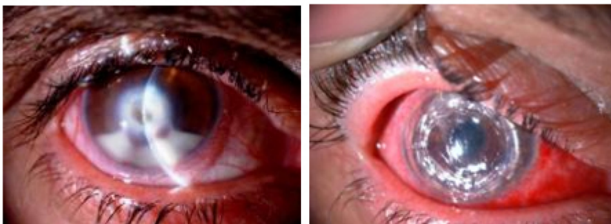
A: dos semanas de evolución con tratamiento antibiótico tópico fortificado por estafilococo áureo (al diagnóstico). B: trasplante de córnea tectónico-terapéutico (a las 48 horas).