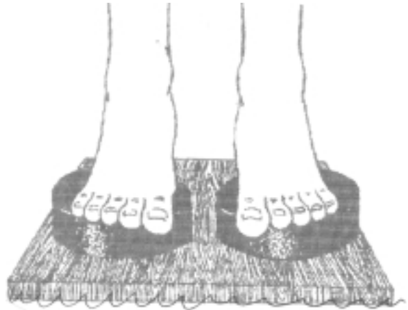
FIG. 3. Método V. Polo norte bajo la planta del pie derecho y polo sur bajo la del izquierdo. Se aplica en dolencias de la parte inferior del cuerpo (bajo abdomen, aparato genital, piernas, tobillos y pies). Entre estas dolencias pueden contarse la gota, circulación irregular o escasa en las piernas, calambres, esquinces, luxaciones, etc.

Método V: Consiste en colocar el polo norte en el pie derecho y el sur en el izquierdo. Se indica en las afecciones de la parte inferior del cuerpo: lesiones de los miembros inferiores, pelvis, columna lumbosacra, genitales, próstata (fig. 3).