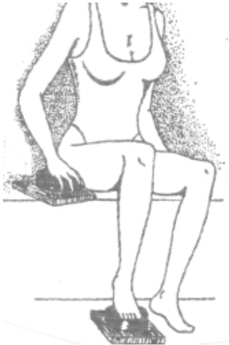
FIG. 2. Método IV. Polo norte bajo la palma derecha y polo sur bajo la planta del pie derecho. Se usa para el tratamiento de enfermedades lateralizadas sobre la derecha como parálisis, polio, hemiplejías, etc., y se alterna con el método III en casos de debilidad general.

Método IV: Consiste en colocar el polo norte en la mano derecha y el sur en el pie derecho. Al igual que el método anterior, se utiliza en las afecciones del lado derecho del cuerpo (fig. 2).