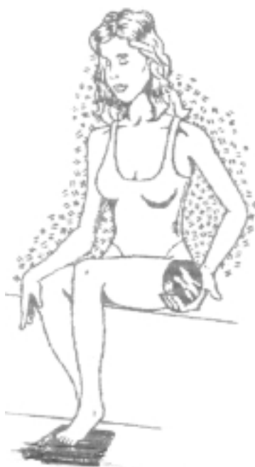
FIG. 5. Ciática sobre el lateral izquierdo. Polo norte sobre la cadera izquierda y polo sur bajo la planta del pie del mismo lado. Se puede repetir esta posición sobre el lado derecho en idénticas condiciones cuando la enfermedad ha tomado ese costado.

Ciatalgia: Colocar el polo norte a nivel del trocánter mayor del fémur del lado afectado y el polo sur en la planta del pie del mismo lado (fig. 5).