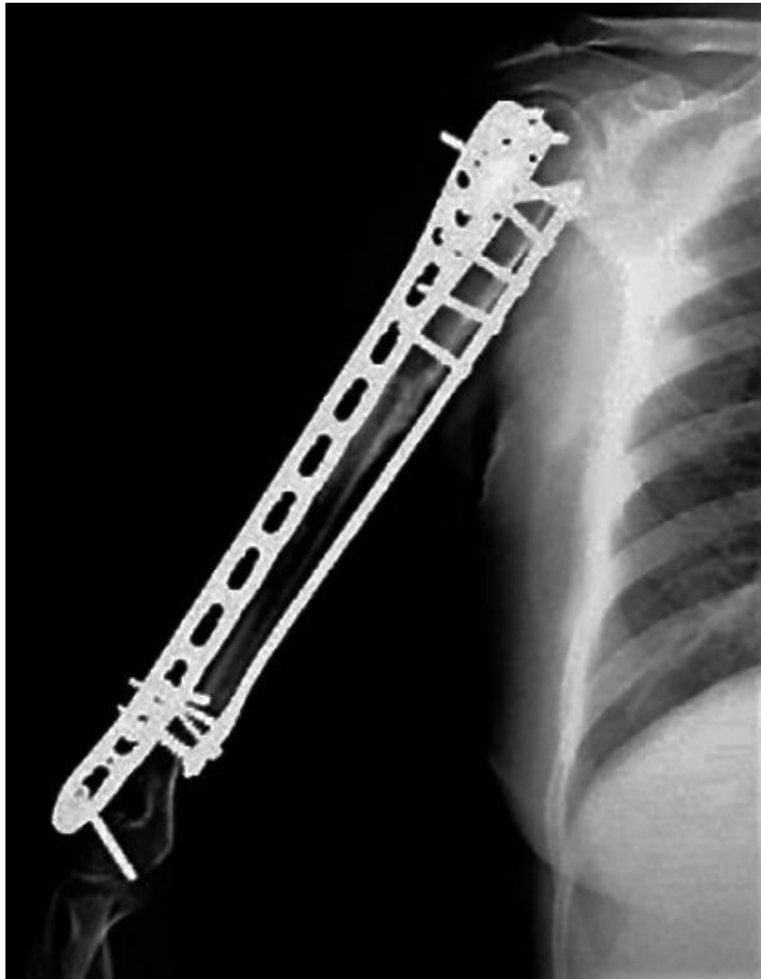
Fig. 3 - Osteointegración completa

Transcurridos dos años, los resultados funcionales y radiológicos del miembro superior dominante fueron considerados buenos (fig. 3).