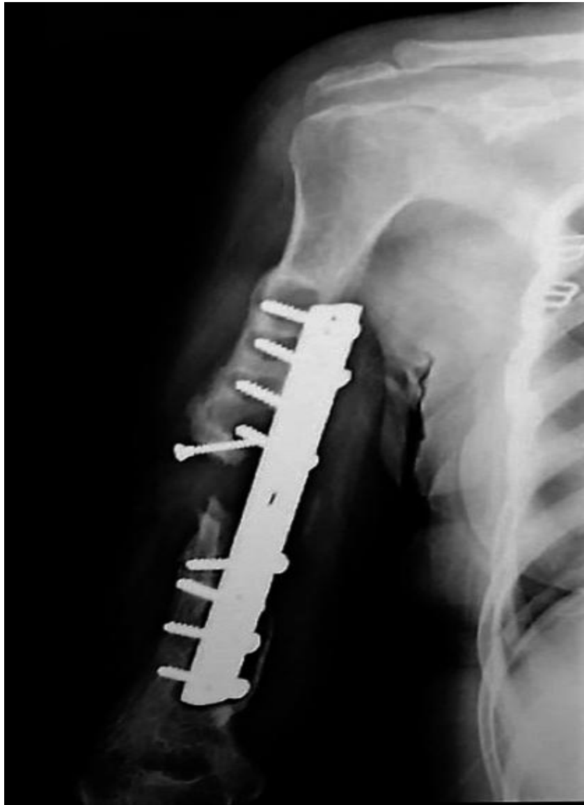
Fig. 1 - Pseudoartrosis atrófica diafisiaria

Se realizó la reconstrucción quirúrgica con la técnica bifásica de Masquelet. En la primera fase se llevó a cabo el desbridamiento de partes blandas y óseas, fue retirado el material de osteosíntesis y se hizo osteotomía de resección de fragmentos desvitalizados, verificados con el signo de Paprika, y el defecto resultante fue de 14 cm de longitud. Se obtuvieron muestras para realizar estudios anátomo patológicos: cultivo, Gram sin centrifugar y antibiograma. Ante la sospecha de infección subclínica, se colocó espaciador de cemento óseo PMMA impregnado con gentamicina. Mediante un cierre primario cuidadoso, se aseguró el espaciador y la cobertura ósea. Luego se estabilizó temporalmente con fijador externo uniplanar (fig. 2).