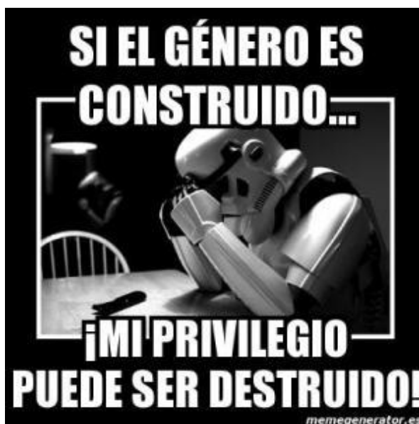
Fig. 1 - Meme “No soy machista”.