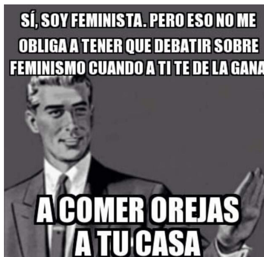
Fig. 5 - Estrategias discursivas presentes en la muestra.