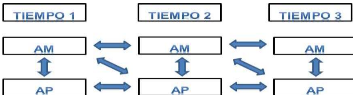
Fig. 1 - Proceso de análisis correlativo a partir del Rozelle-Campbell baseline.