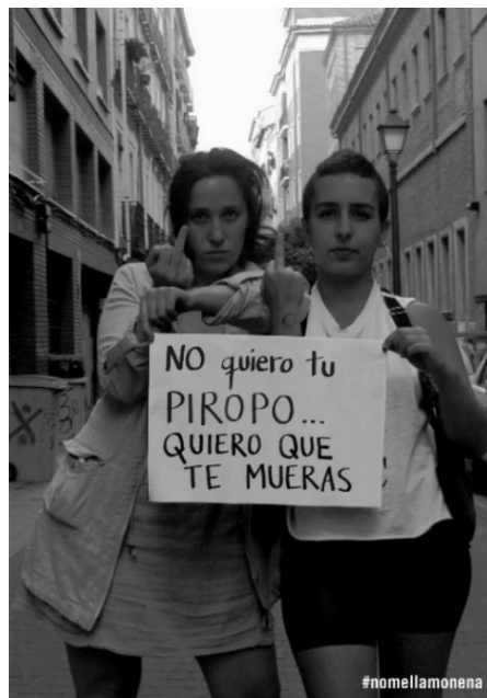
Fig. 2- Imagen de la campaña callejera #Nomellamonena.

La iniciativa se inspira en una obra de la estadounidense Tatyana Fazlalizadeh, quien trabaja a partir de mujeres reales pero con lemas basados en la cosificación del cuerpo femenino o los roles de la mujer en el espacio público (Larrañeta, 2004 en Zurbano, Liberia y Bouchara, 2016).