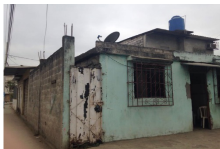
Figura 7. Estado actual de las viviendas: Fachadas inconclusas.

Referente a la mayor tendencia en el uso de los espacios de la vivienda, se ubica a la zona íntima o de descanso, luego se sitúa la sala para ver la televisión y socializar. En tercer lugar el comedor, y estudiar y en menor frecuencia preparar alimentos. Esto por cuanto muchos de los miembros de las familias se reúnen en la noche al volver de sus actividades laborales y de estudio.