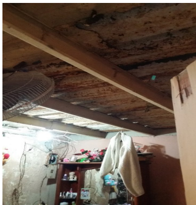
Figura 5. Dormitorios de 9 m 2 sin closet

Es importante resaltar que para los diseñadores de las viviendas de El Recreo solo han sido importantes los espacios básicos de la vivienda mínima, más se olvidaron de proyectar los closets. El 25% de las familias debieron construir los closets en los dormitorios dentro de la superficie de 9 m 2 , reduciendo aún más el espacio de los mismos; las familias que no pudieron hacerlo deben guardar la ropa en armarios, cómodas, cajoneras, y también en cordeles tendidos dentro de los dormitorios.