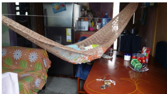
Figura 2. Espacios reducidos

Las viviendas en un 80% son unifamiliares, es decir que son habitadas por una sola familia, y en un 20%, que representan 2400 viviendas son habitadas por dos familias debido a que los hijos heredan la casa de los padres y en situaciones más aisladas habitan tres familias en un 6%, que representan 720 viviendas, por las causas antes descritas.