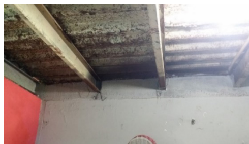
Figura 6. Losas de material metálico sin mantenimiento.

El 80% de las viviendas son de construcción tradicional, es decir de hormigón armado, paredes de bloques enlucidas y piso de hormigón simple, otras ya han sido recubiertos sus pisos con baldosas y/o cerámicas. El 18% son viviendas prefabricadas principalmente por la construcción de losas metálicas, y el 2% son mixtas, es decir de hormigón y madera, claro está porque corresponden a viviendas invadidas, las que se encuentran en pésimo estado de conservación.