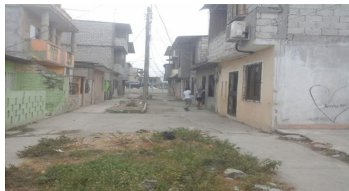
Figura 4. El 73% de las viviendas han sido modificadas

Los espacios en prioridad para las modificaciones son en un 26% la sala, seguido del comedor, cocina, un dormitorio más, también hay unas cuantas familias que desean aumentar dos dormitorios, esto se justifica por el hacinamiento de una gran cantidad de viviendas donde habitan 2 y 3 familias en un 24%, excediendo el número de miembros hasta más de 9 personas.