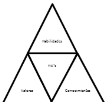
Figura 2. Modelo de perfil de competencias.

En las instituciones se debe identificar el personal académico que ayuden al éxito estratégico para ello los requerimientos actuales de los puestos de docencia deben cumplir con abundante detalle, una tarea que a menudo se conoce como la fijación del perfil del puesto de trabajo o perfil competencial. Aquí las TIC son el centro de todo requerimiento para luego describir los conocimientos, habilidades y valores que necesita el puesto de trabajo