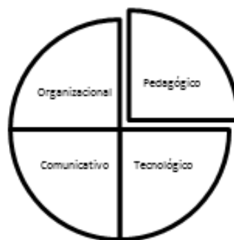
Figura 1. Componentes de la implementación tecnológica.

Suñe, Bravo, Mundet & Herrera (2012), destacan que los esfuerzos de las instituciones educativas se deben concentrar en a) sensibilizar a los docentes sobre la importancia de implementar tecnologías dentro de su metodología pedagógica, b) estructurar un equipo profesional que responda a las complejidades inherentes a la implementación tecnológica desarrollando estrategias en cuatro componentes: