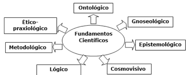
Figura 2. Fundamentos científicos de la investigación.

El proceso de la investigación científica ineludiblemente está mediado por la cosmovisión que posea y la posición filosófica que asuma del investigador con respecto al objeto de estudio. De tales circunstancias se definen los fundamentos científicos que caracterizan al enfoque filosófico en el que se sustenta la investigación.