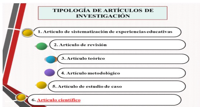
Figura 1. Tipología de artículos de investigación.

Véase en la figura 1 una sistematización sobre la tipología que propone el autor: