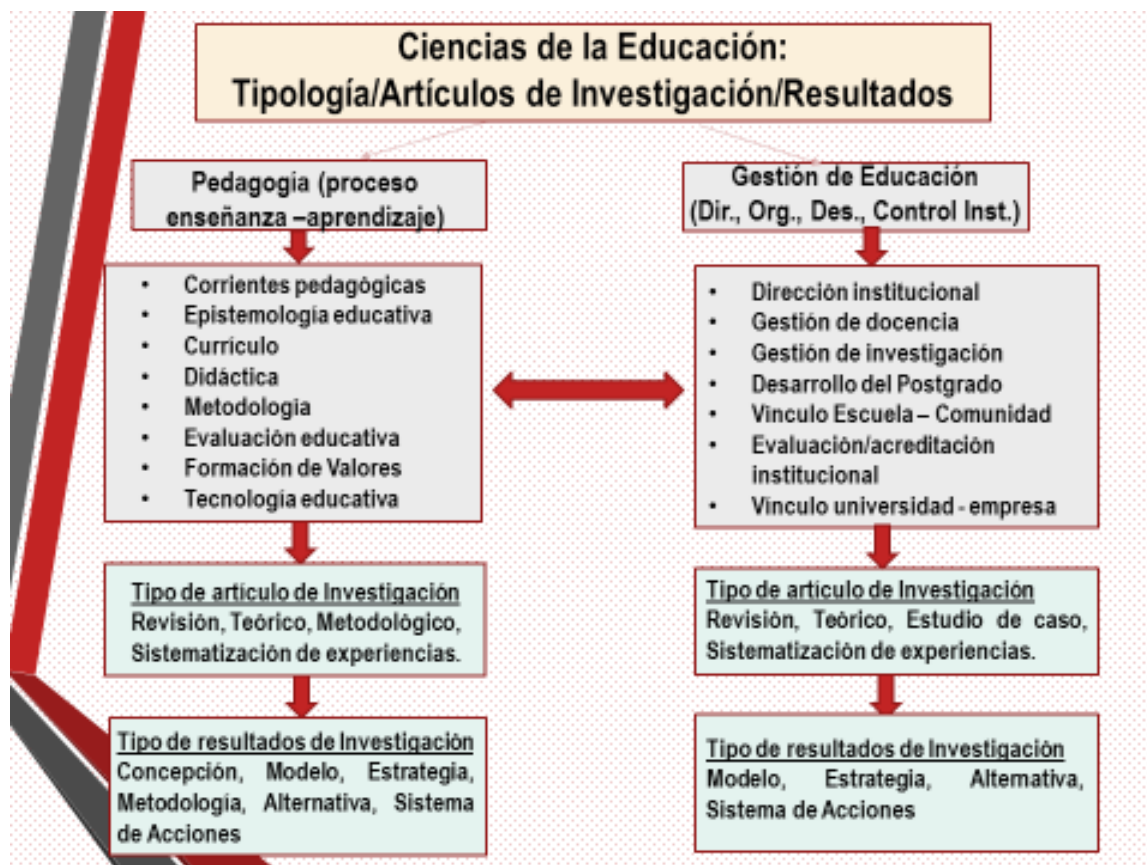
Figura 2. Presentación aplicada de los elementos de “saber epistémico” en “Ciencias de la Educación”.

Para el caso de Ciencias de la Educación (investigación educativa), en la figura 2 se muestra su relación: