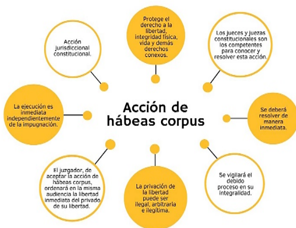
Figura 2. Acción del hábeas corpus.

De lo analizado anteriormente se infiere que, la acción de hábeas corpus se compone de ciertos elementos jurídicos que son fundamentales desde el punto de vista constitucional y supranacional y que por ende deben ser identificados en toda su extensión (Figura 2).