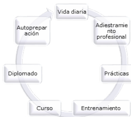
Figura 1. Formas generales para el desarrollo de la superación docente.

Para la superación de los docentes (Figura 1) se promueve la colaboración interinstitucional, aprovechando las diferentes formas organizativas, tales como: concentrados metodológicos, reuniones y asesoramientos metodológicos, los talleres, seminarios, encuentros e intercambios de experiencias, la participación en entrenamientos, ejercicios u otras que propicien el estudio o la divulgación de la ciencia o la tecnología (Rodríguez et al., 2018).