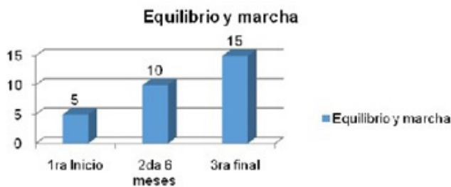
Figura 2. resultados de la paciente al aplicar el Test de Tinetti

En la Figura 2, muestra los resultados que se obtuvieron con la paciente al aplicar el Test de Tinetti en tres momentos del estudio. En la prueba inicial obtuvo 5 puntos, presentando dificultades en patrones de la marcha, como el inicio de la deambulaci3n, longitud y altura del paso, la continuidad del paso y en el equilibrio est1tico en bipedestaci3n. En el corte a los seis meses la paciente obtiene 10 puntos, para un 35,8%, con una mejoría comparada con la prueba inicial.