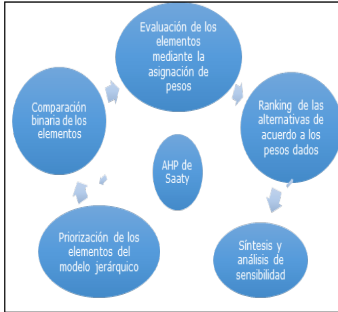
Figura 1. Metodología AHP de Saaty.

básica está compuesta por: metas u objetivos generales, criterios y alternativas (Ozturk, 2020). La jerarquía está construida de manera que los elementos sean del mismo orden de magnitud y puedan relacionarse con algunos del siguiente nivel (Figura 1).