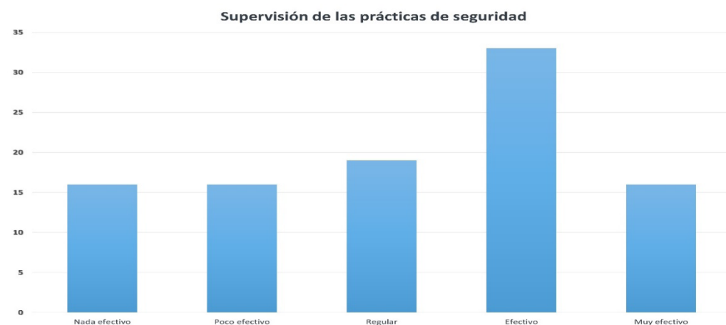
Fig. 2: Supervisión de la empresa sobre las prácticas de seguridad.

Supervisión de prácticas de seguridad: evidencia una variedad de percepciones entre los empleados. Un 33.76% considera la supervisión como efectiva, mientras que el 15.58% la cataloga como poco efectiva, nada efectiva o muy efectiva. Estos resultados resaltan la importancia de evaluar y mejorar las prácticas de supervisión para fortalecer aún más la seguridad en el lugar de trabajo y abordar las áreas donde se percibe una falta de efectividad.