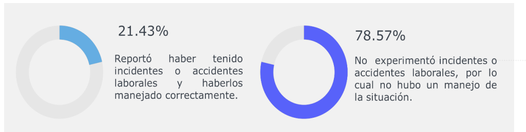
Fig. 3: Experiencia de incidentes o accidentes laborales después de recibir formación en seguridad y salud.

Experiencia de incidentes o accidentes laborales post formación en SST / Percepción sobre la utilidad de la formación en SST para manejar adecuadamente un accidente laboral: los datos revelan que el 21.43% de los empleados de la Compañía Tranec Sur han experimentado un incidente o accidente laboral desde que recibieron formación en SST, mientras que el 78.57% restante no ha experimentado ninguno. De aquellos que sí experimentaron un accidente, el mismo porcentaje del 21.43% ha manejado la situación en el accidente (Figura 3).