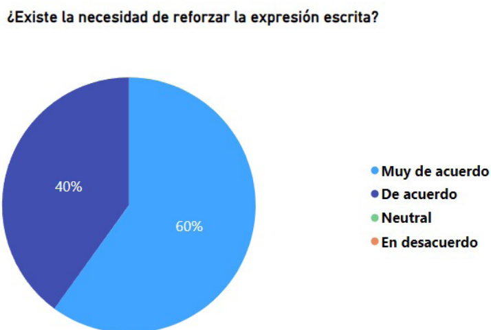
Fig 1: Necesidad de reforzar expresión escrita

En Rodríguez y Viñas (2019) se exponen tres ejemplos modelos de cómo enseñar la “Producción Escrita” en “Lengua Extranjera”. Por ejemplo, en las clases, hay que enfocarse en el hecho de que los estudiantes vean la escritura como una actividad de socialización. Ellos centran las tareas de aprendizaje en la interacción entre el rol de escritor y los textos que escriben, con los lectores, enfatizando en el propósito comunicativo del texto que los estudiantes-lectores deben ser capaces de identificar para alcanzar una comunicación exitosa. En este ambiente, los estudiantes entienden que el texto varía como resultado de la interacción social y están entrenados en estas prácticas. La clase refleja el componente sociocultural de la lengua sin descuidar el significado y la función que se relacionan coherentemente, además de considerar el uso del lenguaje y los elementos adecuados al propósito y contexto del texto y la actividad de escritura en general. Estas reflexiones teóricas y los resultados de esta investigación conducen a deducir que es necesario realizar una revisión de la enseñanza de la competencia escrita en la Carrera de Lenguas Extranjeras, potencializando al mismo tiempo el recurso a las clínicas de reforzamiento.