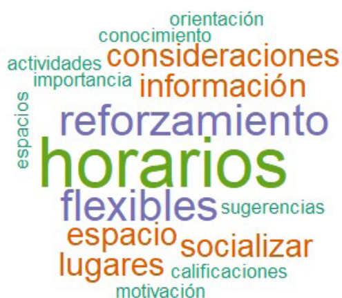
Fig 3: Recomendaciones para continuidad de las clínicas de reforzamiento

unas pequeñas de las transcripciones realizadas. Para el caso, la docente DC2 mencionó que “Se debería de dar más información acerca de las clínicas ya que hay estudiantes que aún no tienen el conocimiento sobre éstas”. Igualmente, el docente DC3 expresa que “Sería interesante socializar el proyecto con los profesores, quizá haya sugerencias que se pudieran tomar en cuenta.” Por su parte, la docente DC5 mencionó que “Necesitamos más referente a las clínicas de reforzamiento, es decir el plan y las actividades a realizar para poder tener conocimiento de este y por ende informar y orientar a nuestros estudiantes, de la importancia de este programa.”