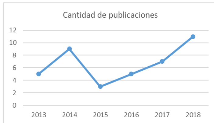
Fig. 1 - Cantidad de publicaciones en los últimos 5 años relacionadas con el uso de ontologías en IR.

De los documentos consultados al respecto se puede decir que los años de más actividad científica en el área son el 2014 y del 2016 a la actualidad con una tendencia al aumento en el 2017 y 2018. En la Figura 1 se ilustra mejor esta conducta.